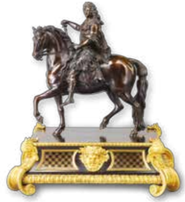
弗朗索瓦·吉哈東 特魯瓦 1628年 - 巴黎 1715年 古羅馬皇帝裝束的 路易十四騎馬像 十八世紀初 塑像：青銅；底座：烏木嵌銅及黃銅、鍍金青銅 François Girardon Troyes 1628 - Paris 1715 Equestrian Statue of Louis XIV as a Roman Emperor Early 18th century Statue: bronze; base: ebony with copper and brass marquetry, gilded bronze 羅浮宮博物館裝飾藝術部 Department of Decorative Arts, Louvre Museum

展覽展示羅浮宮博物館豐富多樣的收藏，包括繪畫、雕塑、陶塑、工藝品、掛毯等，希望藉著這次千載難逢的機會，讓觀眾可以近距離欣賞羅浮宮不同時期的藝術瑰寶，並了解其源遠流長的歷史，與羅浮宮一起走過一場交織著藝術與歷史的八百年之旅。