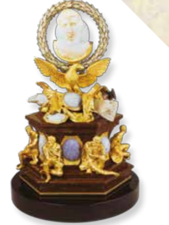
浮雕奧古斯都像 (奧古斯特·卡佩涅亞) 羅馬薩拉亞大道、普黎史拉基窟出土 羅馬製造 一世紀初(寶石浮雕)；羅馬帝國時期(其他雕飾)； 1785年(路易吉·瓦拉迪耶鑲嵌) 玉髓、水晶、瑪瑙、大理石、 金、銅合金、琺瑯 Cameo of Augustus (Auguste Carpegna) Discovered in the catacomb of Priscilla on Via Salaria in Rome Made in Rome Early 1st century (cameo); imperial era (other pieces of carving); 1785 (mount by Luigi Valadier) Chalcedony, rock crystal, agate, marble, gold, copper alloy, enamel 羅浮宮博物館希臘、伊特魯里亞、羅馬文物部 Department of Greek, Etruscan, and Roman Antiquities, Louvre Museum